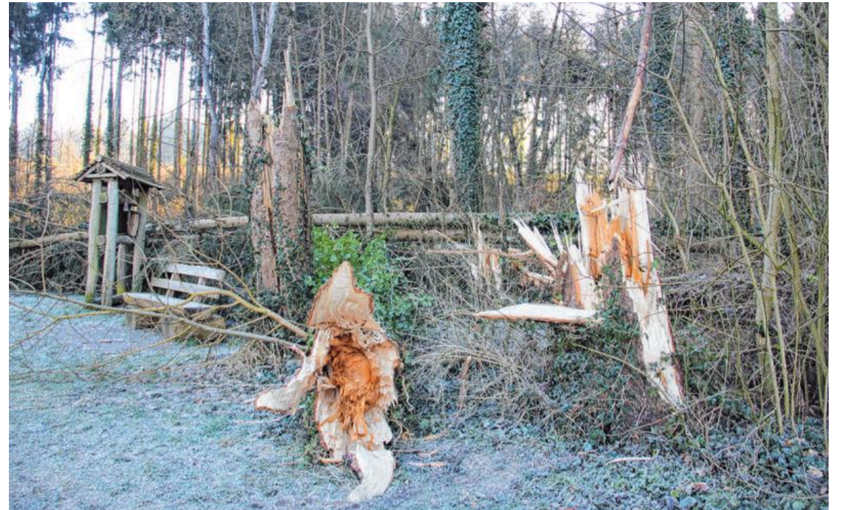
Die Situation am Gossenberger Wald in Ravensburg nach Sturm „Petra“. In der Mitte des Baumes ist die Rotfäule, die den Baum angegriffen hat, deutlich sichtbar.

In den kommenden Tagen ist Fürgut wohl aber erst einmal mit der Erfassung der Schäden beschäftigt, die die Stürme „Petra“ und „Sabine“ angerichtet haben. „Es wird bis in die nächste Woche hinein dauern, bis ich einen kompletten Überblick über die Schäden habe“, sagt er. Die umge-